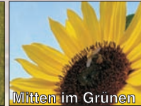
Mitten im Grünen