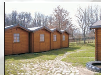
Feriensiedlung Pulsnitztal (26 Betten)