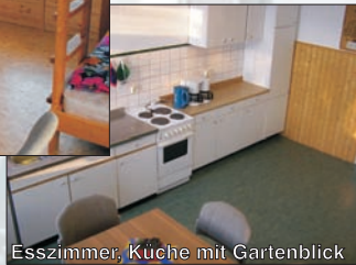
Esszimmer, Küche mit Gartenblick