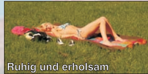
Ruhig und erholsam

Im Sommer wie im Winter bietet Ihnen unser Selbstversorgerhaus eine familiäre Atmosphäre, Ruhe und Erholung. Besuchen Sie die Sehenswürdigkeiten vor Ort, und nutzen Sie die Nähe zu Dresden und der Oberlausitz. Das Haus ist gut geeignet für Familien, Kleinstkinderheime, Kinder- und Jugendfreizeiten.