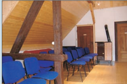
Medienraum mit Kachelofen

2 Doppelzimmer, 1 Vierbettzimmer, Medienraum, Du/WC