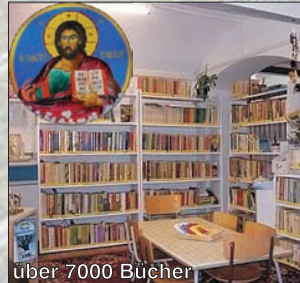
über 7000 Bücher

Bibliothek, Ikonenausstellung, Tischtennisraum, Ausstellung