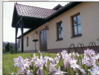
Ferienwohnung Dresden (3 Betten)