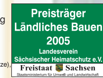
Landesverein Sächsischer Heimatschutz e.V. Freistaat Sachsen

Möglichkeit der Nutzung unseres ehemaligen Gewächshauses, Gruppenraum (20 Plätze), Keramikwerkstatt (15 Plätze), 2 Du/WC