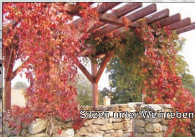
Sitzen unter Weinreben